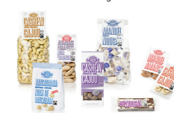
FEINKOST Sortiment von Pakka.

Die PAKKA AG wurde 2006 von zwei Jungunternehmern, einem Agronomen und einem Forstwirt, in Zürich gegründet, um nachhaltige Lieferketten für Nüsse aus Entwicklungsländern in die Schweiz und nach Europa aufzubauen. Das Sortiment umfasst heute Cashew-Nüsse aus Indien, Mandeln aus Palästina und Pakistan, Erdnüsse aus China, Macadamia aus Kenia, Paranüsse aus Bolivien und neuerdings auch Haselnüsse aus Georgien. Der Ver-